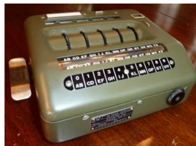
Kryapp 301