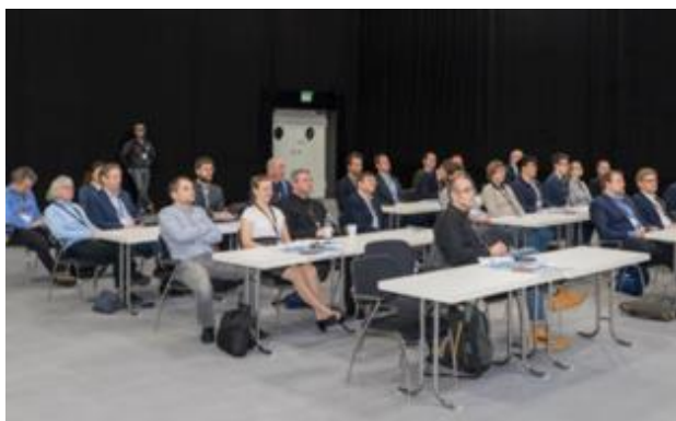
Die Teilnehmer des Chapter-Meetings.